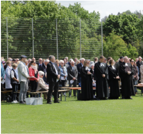
Himmelfahrt 2023

Auch in diesem Jahr wollen wir wieder einen gemeinsamen Himmelfahrtsgottesdienst zusammen mit den Kirchengemeinden der Christuskirche und der Kreuzkirche auf dem Sportplatz in Gläserzell feiern. Er findet am Donnerstag, 9. Mai , um 11.00 Uhr statt. Die musikalische Gestaltung liegt wie immer in den Händen der Gruppe „Esprit“. Gleichzeitig wird ein Kindergottesdienst angeboten. Im Anschluss an den Gottesdienst lädt der Sportverein Gläserzell zum Beisammensein bei Flurgönder, Gegrilltem, Kaffee und Kuchen ein.