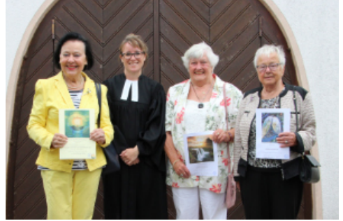
Jubiläumskonfirmation 2023