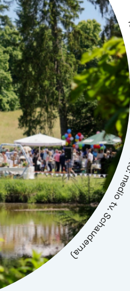
Taufest unter freiem Himmel