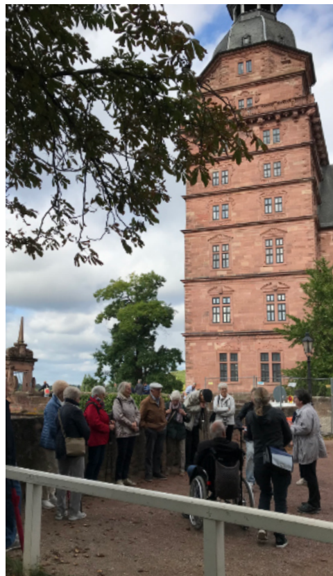
Gemeindefahrt nach Aschaffenburg 2023

Auch in diesem Jahr machen wir uns wieder auf den Weg, und zwar nach Alsfeld. Sie können sich gern schon anmelden (Tel. 52690), die weiteren Einzelheiten folgen im nächsten Gemeindebrief.